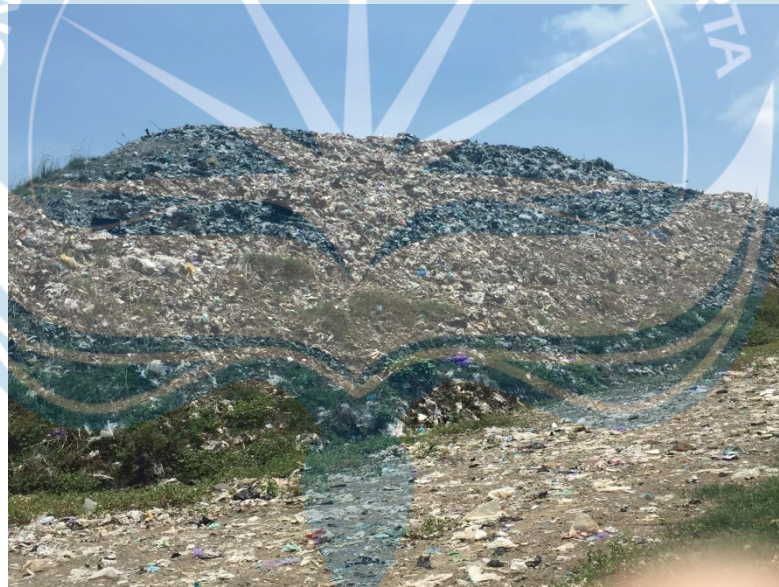
Lampiran 9 Gambar 4. Kondisi Tempat Pemrosesan Akhir (TPA) Winong Kabupaten Boyolali