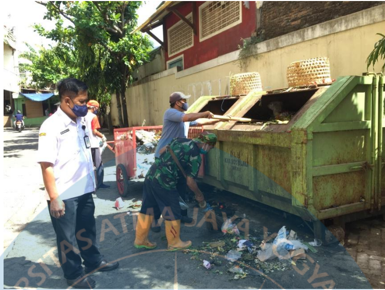
Lampiran 8 Gambar 3. Kondisi Container Sampah Pasar Kota Boyolali