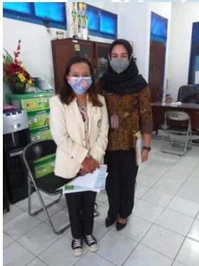
Gambar 4. Wawancara dengan DinsosP3AKB Kabupaten Pati