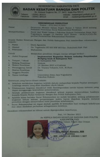
Gambar 7. Surat rekomendasi penelitian dari KESBANGPOL Kabupaten Pati