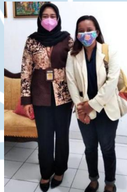
Gambar 5. Wawancara kedua dengan DinsosP3AKB Kabupaten Pati