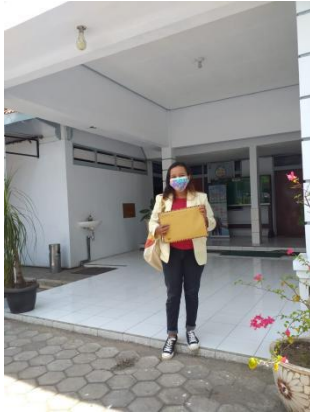
Gambar 1. Mengajukan berkas dan izin ke DinsosP3AKB Pati