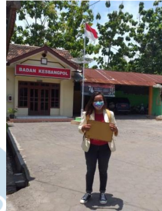
Gambar 3. Mengajukan berkas dan izin ke KESBANGPOL PATI