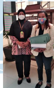
Gambar 6. Wawancara dengan Hakim Pengadilan Negeri Pati Kelas IA