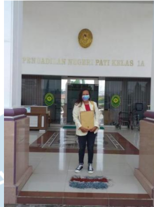
Gambar 2. Mengajukan berkas dan izin ke Pengadilan Negeri Pati Kelas IA