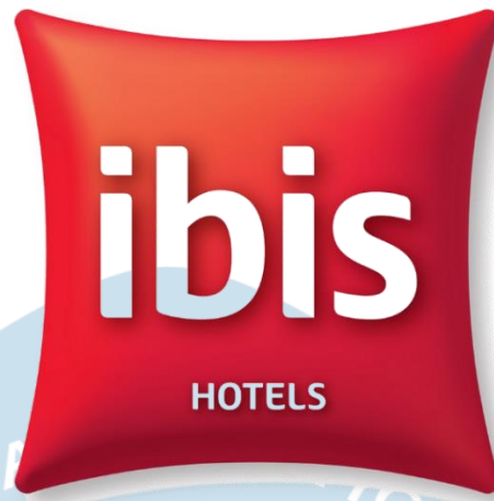
Gambar 6. Logo Hotel Ibis Yogyakarta Malioboro

Hotel Ibis Yogyakarta Malioboro memiliki visi yaitu Accor merupakan pemimpin di dunia perhotelan dan pariwisata Asia Pasific. Kekuatan hotel yaitu terletak pada keunikan produk yang beraneka ragam, merek-merek kelas dunia dan jaringan hotel terbaik. Selain itu budaya Accor yang dimiliki yaitu guest passion, respect, innovation, trust, sustainable development , dan spirit of conquest .