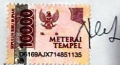
Nicodemus Prabowo Utomo