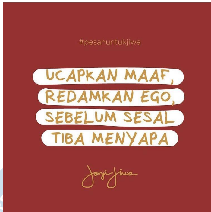
Gambar 2.1 Quotes Model 1 pada Tutup Kemasan Janji Jiwa