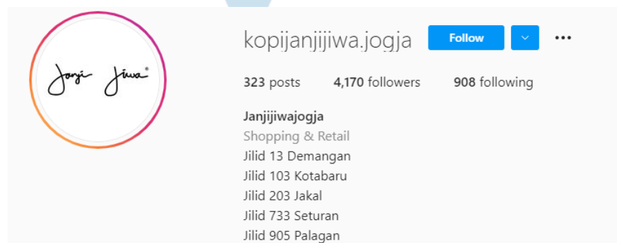
Gambar 2.5 Profil Akun Instagram Janji Jiwa Yogyakarta

Akun Instagram Janji Jiwa di wilayah Yogyakarta yaitu @kopijanjiwiwa.jogja memiliki pengikut sebanyak 4.170 pengguna (per tanggal 30 Oktober 2021).