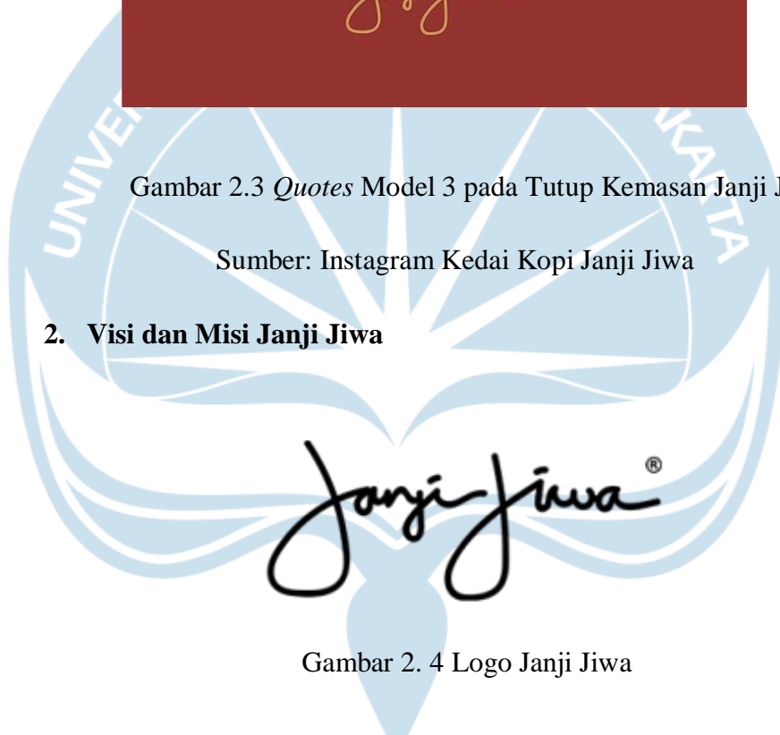
Gambar 2. 4 Logo Janji Jiwa