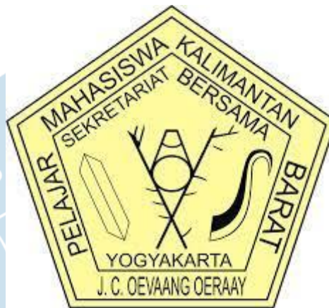
Gambar 2.1 Logo SEKBER PMKB “J.C. Oevaang Oeray”

Logo SEKBER PMKB “J.C. Oevaang Oeray” memuat tiga unsur utama yang digambarkan pada Gambar 2.1. Gambar Perisai atau tameng di kiri memiliki arti yang cukup dalam bagi masyarakat suku Dayak, karena selain digunakan untuk bertahan saat perang pada jaman dahulu, tameng juga menggambarkan identitas suku Dayak, dari suku mana sang pemilik berasal, pangkat apa yang dia punya dan prestasi apa yang telah dia dapat. Semua itu tergambar melalui ukiran atau lukisan yang ada pada tameng. Pada logo SEKBER PMKB “J.C. Oevaang Oeray, perisai atau tameng tidak memiliki ukiran, yang diartikan bahwa tidak ada lagi memandang suku, ras, agama, budaya dan pangkat. Semuanya sama dan semuanya adalah satu keluarga. Kemudian unsur kedua adalah bambu dan gong. Bambu merupakan sebuah tanaman yang memiliki banyak kegunaan, hal inilah yang juga SEKBER PMKB “J.C. Oevaang Oeray” inginkan, bahwa dengan adanya organisasi ini diharapkan dapat banyak berguna untuk membantu banyak orang, terutama untuk