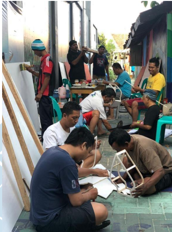
Gambar 2. 2 Kerja Bakti Warga Sutodirjan RW 20