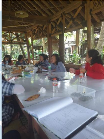
Gambar 2. 3 Arisan PKK RW 20

berpatroli menjaga keamanan kampung, warga yang mendapat giliran ronda juga harus mengumpulkan jimpitan atau iuran sukarela yang biasanya diletakkan dalam wadah kecil di depan rumah-rumah warga. Jumlah iuran yang terkumpul akan masuk ke kas RW 20.