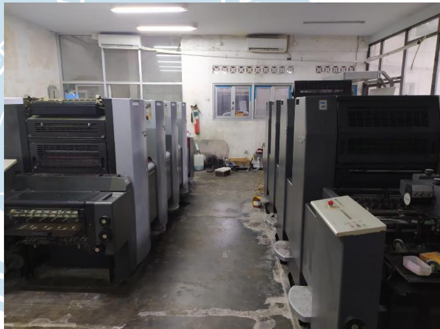
GAMBAR 3: Mesin Offset Heidelberg SM52 untuk memenuhi kebutuhan konsumen volume tinggi

kualitas yang terbaik, @mclrpint menggunakan mesin Heidelberg SM 52 yang terdiri atas 4 plat warna, yakni Cyan, Magenta, Yellow, dan Black (CMYK) serta mesin Oliver yang terdiri dari satu slot warna dan hanya diperuntukan cetakan dengan satu warna.