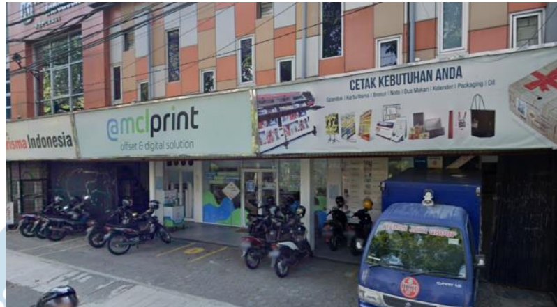
GAMBAR 2: Bagian depan toko @mclprint