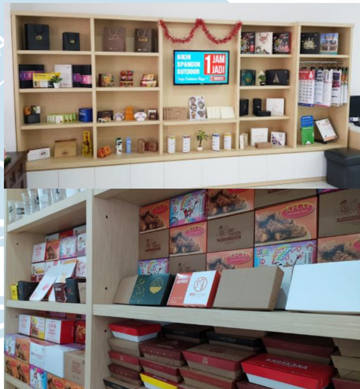
GAMBAR 4: Display contoh produk yang dihasilkan @mclprint