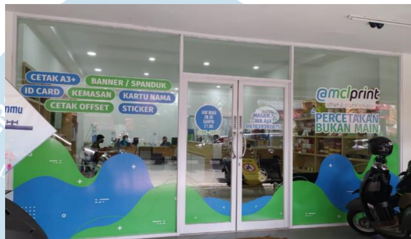
GAMBAR 1: Percetakan @mclprint