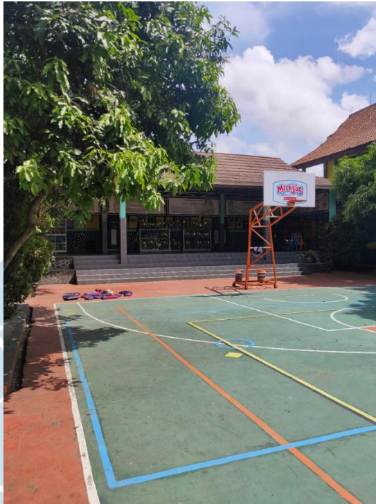
Gambar 6. Kondisi Sekitar Titik 3