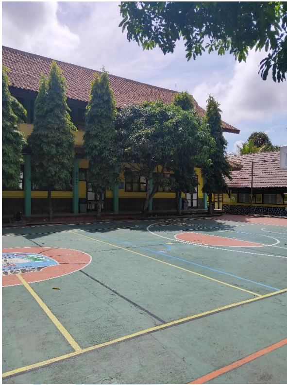
Gambar 4. Lapangan Basket SMP N 5