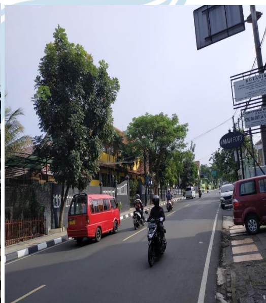
Gambar 3. Kondisi Sekitar Lokasi