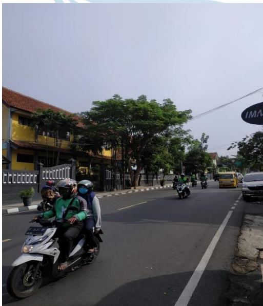
Gambar 2. Kondisi Sekitar Lokasi