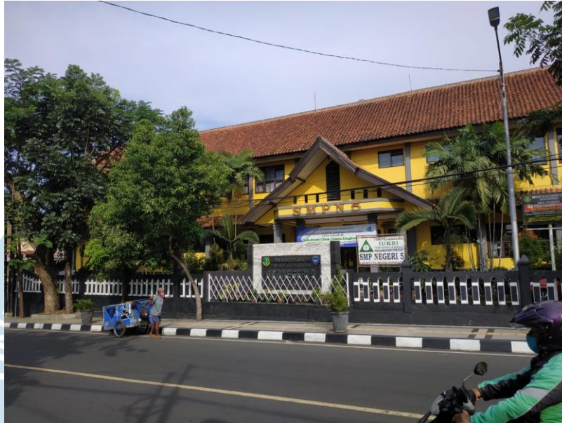
Gambar 1. Tampak Depan SMP N 5