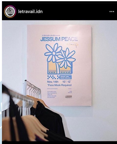
Gambar 2.6. Poster Event pada Laman Instagram Le Travail Coffee Shop Yogyakarta