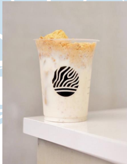
Gambar 2.3 Salah satu produk Coffee Le Travail Coffee Shop Yogyakarta