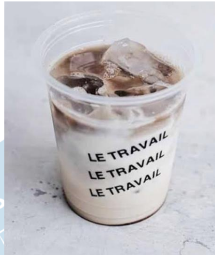
Gambar 2.4 Salah satu produk Coffee dan Packaging Khas Le Travail Coffee Shop Yogyakarta (Sumber: Observasi Peneliti, 2022)