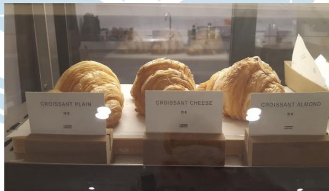
Gambar 2.5 Menu pastry Le Travail Coffee Shop