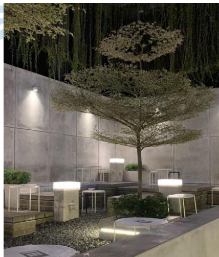
Gambar 2.2 Bagian Outdoor di Le Travail Coffee Shop Yogyakarta