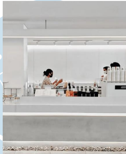
Gambar 2.1 Bagian Indoor di Le Travail Coffee Shop Yogyakarta

Le Travail Coffee Shop yang berada di kawasan Jl. Laksda Adisucipto No. 19, Gondokusuman, Yogyakarta memiliki konsep industrial. Konsep industrial ini memberi nuansa abu-abu dan cocok dengan gaya interior cafe.