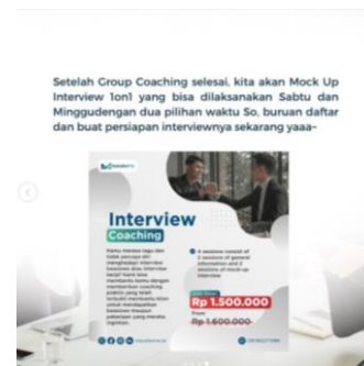
Gambar 2.5 Contoh Konten 4