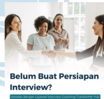
Gambar 2.3 Contoh Konten 2