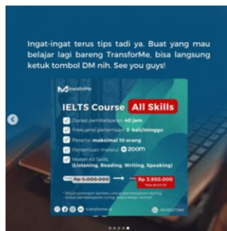
Gambar 2.4 Contoh Konten 3