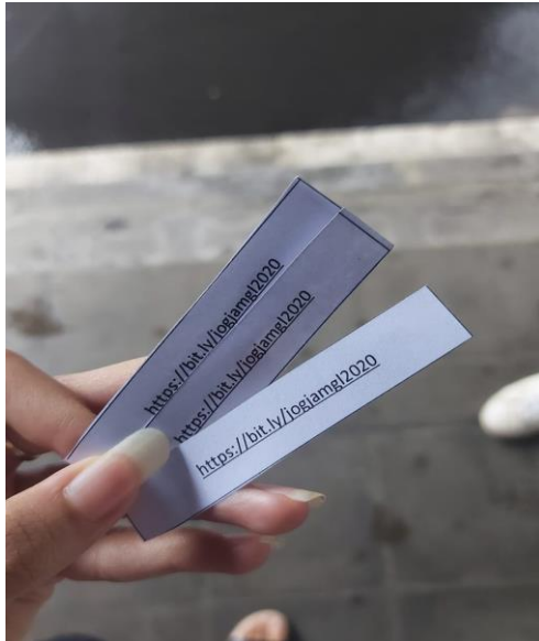
Kertas link kuisioner yang disebar