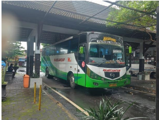
Foto bus antar kota Yogyakarta - Magelang