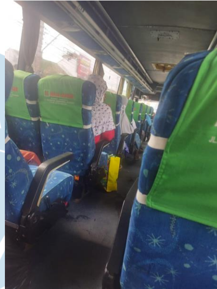
Keadaan di dalam bus antar kota