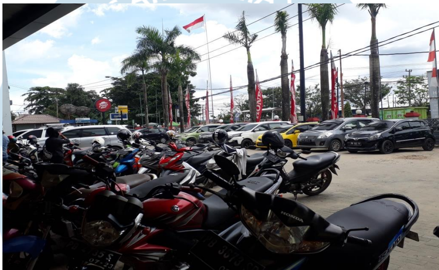
Gambar 1.1 Lokasi Parkir yang Penuh

Banyaknya pengunjung yang datang mengakibatkan ruang parkir di Mega Mall Sorong tidak mampu lagi menampung kendaraan pada waktu-waktu tertentu. Kendaraan yang tidak mendapatkan tempat parkir cenderung akan memarkirkan kendaraannya pada bahu jalan yang terdapat di depan gedung mall . Hal ini akan berdampak pada terganggunya fungsi jalan dan kelancaran lalu lintas sehingga seringkali terjadi kemacetan pada Jalan Basuki Rahmat.