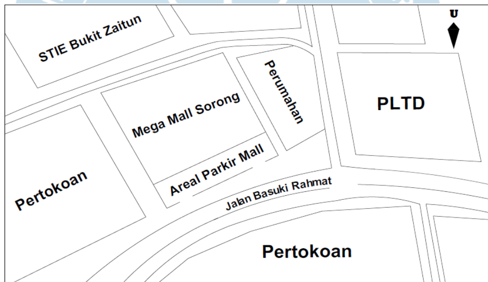
Gambar 1.4 Peta Situasi Mega Mall Sorong, Papua Barat