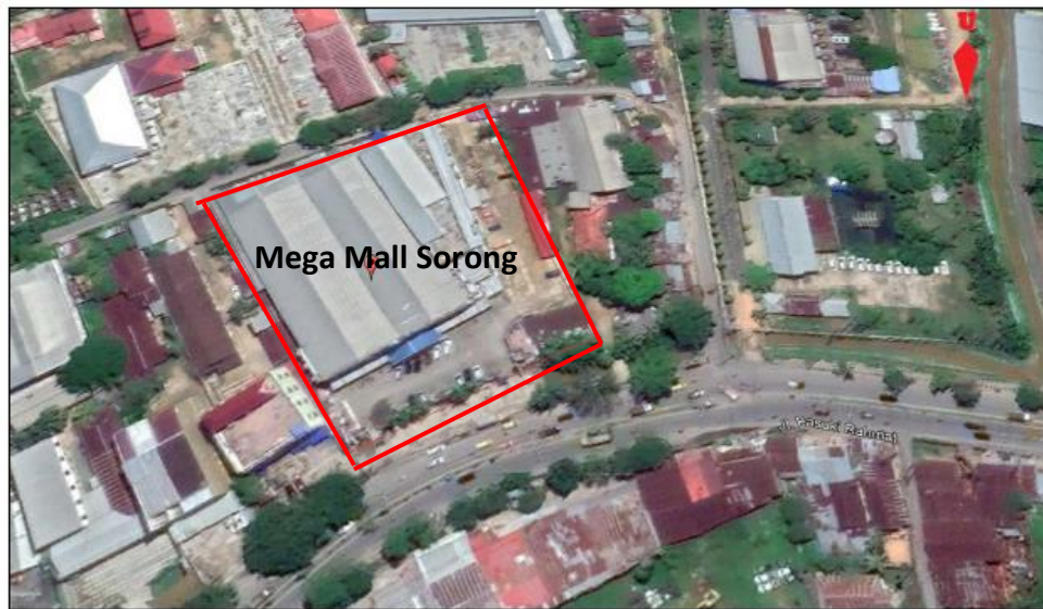
Gambar 1.3 Lokasi Mega Mall Sorong, Papua Barat (Google Earth, 2020)