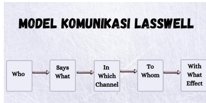
Gambar 10 Model Komunikasi Laswell

Berdasarkan model Laswell, maka dapat dikatakan bahwa komunikator menjadi sumber dan pemegang kendali utama dalam aktivitas komunikasi. Karena, jika proses komunikasi tidak berjalan dengan baik, maka kesalahan utama bisa bersumber dari komunikator. Hal ini disebabkan, komunikator tidak memahami penyusunan pesan, tidak memilih media yang tepat, dan tidak mendekati audience yang menjadi target sasaran (Suryadi, 2021: 31).