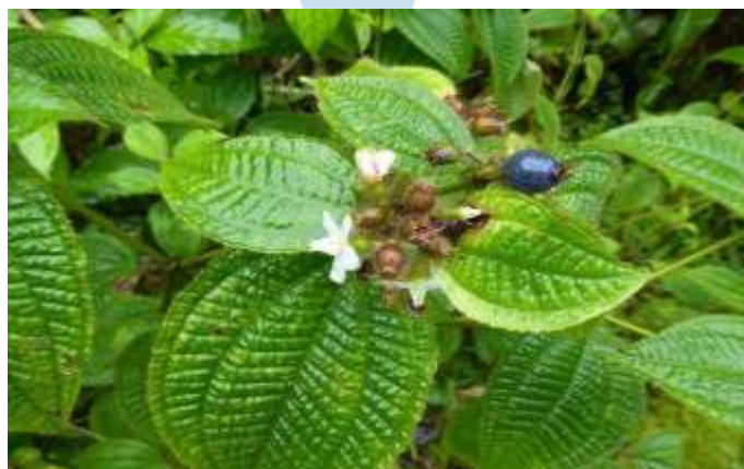
Gambar 1. Herba Harendong Bulu ( C. hirta )