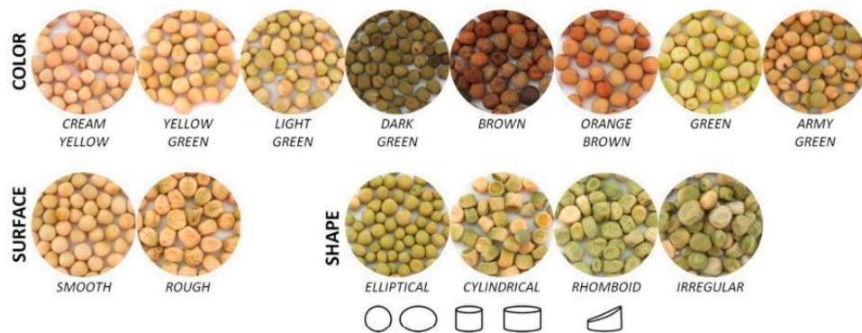
Gambar 3. Kacang Polong ( Pisum sativum ) dalam Berbagai Warna dan Bentuk (Santos dkk., 2019).

dan kualitasnya. Biji kacang polong ditunjukkan pada Gambar 3.