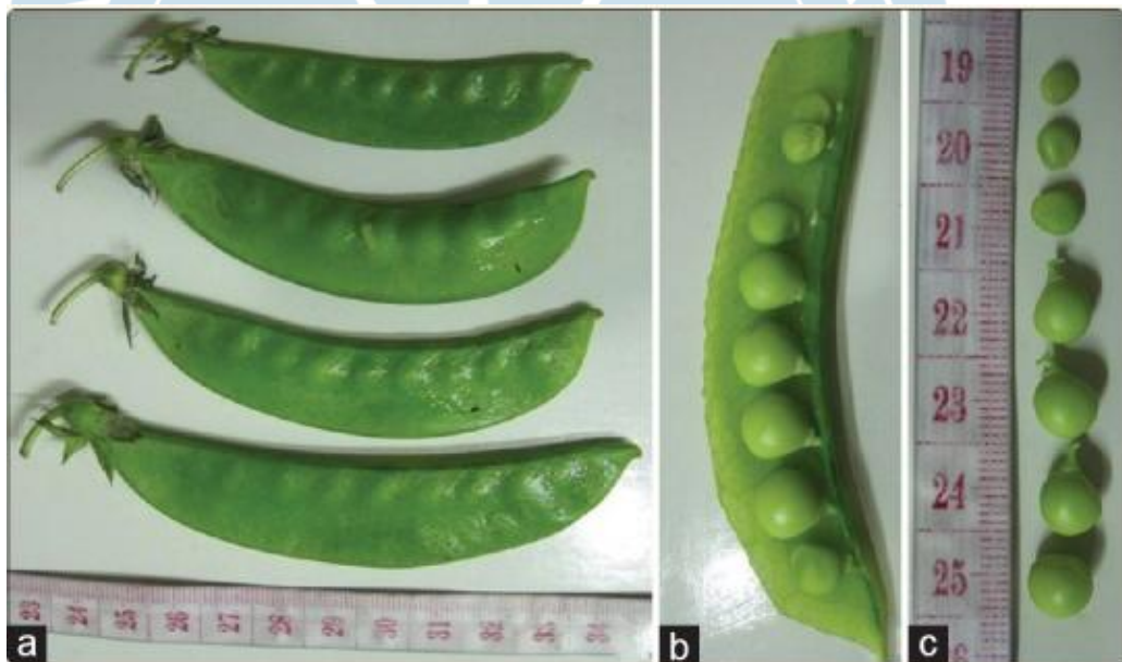
Gambar 2. Morfologi luar (a); Potongan Kacang Polong (b); Biji Kacang Polong (c) (Rungruangmaitree dan Jiraungkoorskul, 2017).

Batang dari tanaman kacang polong berongga yang tumbuh hingga 2-3 m. Daunnya berseling dan majemuk menyirip, terdiri atas 2-3 pasang stipula sepanjang 1,5-8 cm. Bunganya mempunyai lima sepal hijau dan lima kelopak putih hingga ungu kemerahan. Buahnya tumbuh menjadi polong dengan panjang 2,5-10 cm, polong merupakan tempat benih yang tersusun atas dua katup tertutup, biji yang dihasilkan berwarna hijau, bulat dan halus (Rungruangmaitree dan Jiraungkoorskul, 2017). Penampakan kacang polong ditunjukkan pada Gambar 2.