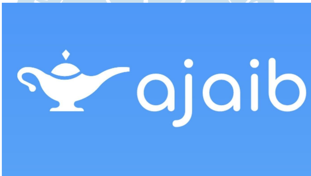
Gambar 2. 2 Logo Ajaib

Ajaib adalah salah satu platform investasi online yang didirikan pada tahun 2019 dibawa naungan Ajaib Sekuritas yang berdiri sejak tahun 2018 bersama dengan PT Takjuk Teknologi Indonesia yang mengelola Ajaib Reksa Dana dan telah terdaftar pada Otoritas Jasa Keuangan (Hema, 2021). Ajaib menawarkan kemudahan untuk berinvestasi baik di reksa dana dan saham secara online serta