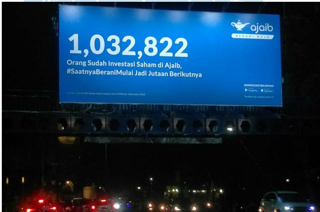
Gambar 2. 3 Baliho Angka Investor di Ajaib

memberikan fasilitas berupa platform trading saham secara real time. Ajaib menyediakan tempat pembelajaran bagi masyarakat pemula maupun yang sudah berpengalaman mengenai investasi. Pendiri Ajaib yaitu Anderson Sumarli bersama dengan rekannya Yada Piyajomkwan memiliki visi untuk meningkatkan angka inklusi keuangan masyarakat Indonesia melalui investasi dengan kemudahan akses terhadap instrumen investasi kepada investor (Sandria, 2021).