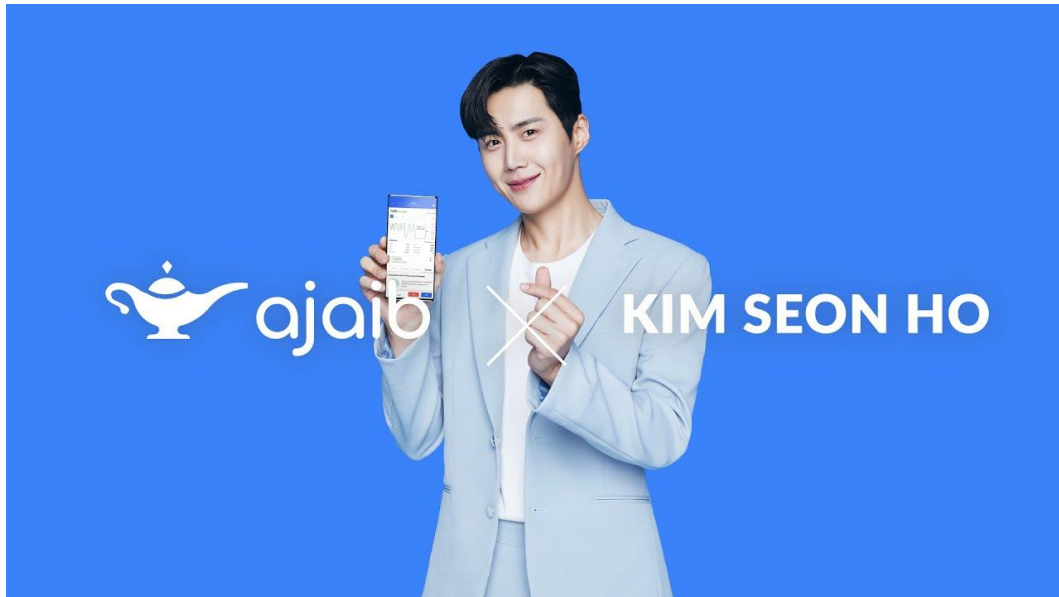
Gambar 2. 4 Thumbnail Youtube Ajaib x Kim Seon Ho

Ajaib sebagai sebuah perusahaan yang berdiri di tengah – tengah persaingan dari para kompetitor memerlukan yang dinamakan strategi pemasaran dengan melakukan promosi kepada masyarakat untuk lebih dikenal. Kegiatan promosi yang dilakukan oleh Ajaib salah satunya adalah promosi lewat iklan diberbagai media seperti media sosial dan media online. Ajaib melakukan strategi marketing lewat penyebaran iklan dengan menggunakan brand ambassador yang merupakan aktor papan atas dari korea bernama Kim Seon Ho. Pada awal tahun 2021 iklan tersebut di upload oleh youtube official Ajaib Investasi dengan menampilkan Kim Seon Ho yang menyampaikan pesan serta ajakan untuk menggunakan aplikasi Ajaib dalam video berdurasi 24 detik. Iklan tersebut dapat dilihat di berbagai media seperti Youtube, Facebook, Website dan media lainnya. Dalam video tersebut Kim Seon Ho menjelaskan serta mengajak para penonton dari iklan tersebut untuk mulai