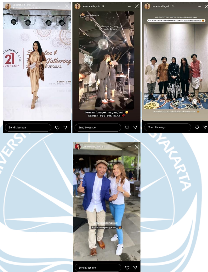
GAMBAR 2.3 Tangkapan layar instastory akun @venerabella_arin