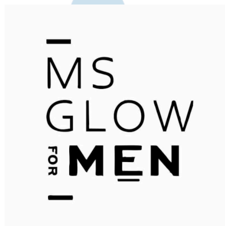
Gambar 2.1 Logo Ms Glow for Men

Dilansir dari situs resmi msglowformenid.com , Ms Glow for Men merupakan brand skincare lokal khusus pria yang didirikan akhir tahun 2019. Dengan slogan “ Real Men Take Care of Their Skin ”, Ms Glow for Men telah berkembang pesat dan memiliki mitra bisnis resmi yang tersebar di seluruh Indonesia. Keunggulan produk Ms Glow for Men sendiri telah memiliki sertifikasi, halal dan sudah teruji secara klinis. Hingga kini, Ms Glow for Men terus berupaya untuk memberikan yang terbaik, termasuk demi kepuasan dan kepercayaan konsumennya, salah satunya melalui pemberian lebih dari 9 cabang clinic yang ditangani oleh para dokter ahli yang tersebar di beberapa kota-kota besar di Indonesia (Ms Glow for Men, 2022).