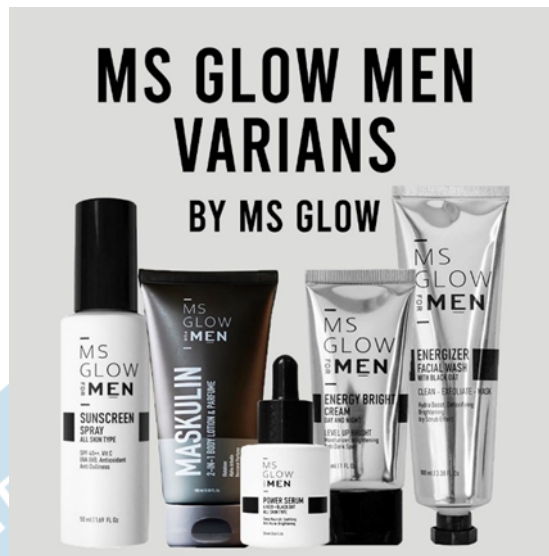
Gambar 2.4 Varian Produk Ms Glow for Men