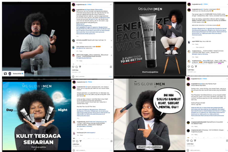
Gambar 2.5 Beberapa Unggahan dari Akun Instagram @msglowformen dengan Babe Cabita

Babe Cabita merupakan pelawak tunggal yang menjuarai ajang Stand Up Comedy Indonesia (SUCI) pada season 3, tahun 2013 lalu. Pria bernama asli Priya Prayogha Pratama ini berasal dari Medan. Berdasarkan hasil wawancara dengan Kompas.com, Babe menjelaskan bahwa panggilan tersebut telah ada sejak SMP, karena tiba-tiba disapa oleh teman-temannya dengan panggilan Be, sedangkan nama belakang Cabita berasal dari muka cabi yang dimilikinya. Kemudian nama Babe Cabita digunakan pada akun Twitter hingga dirinya menjadi seleb tweet dan digunakan sampai sekarang (Lova, 2020).