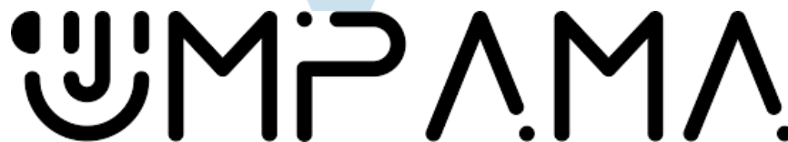
Gambar 2.2 Logo Umpama Coffee