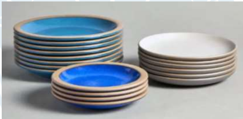
Gambar 1. 1. Berbagai Jenis Piring Keramik

Hasil riset bersama dalam program Matching Fund Kedaireka 2021 menghasilkan inovasi dalam produk keramik bermotif batik, khususnya Batik Kawung. Batik Kawung sendiri merupakan corak batik khas dari daerah Yogyakarta dengan ornamen motif geometrik. Motif Batik Kawung memiliki bentuk geometri seperti bentuk daun yang sederhana, namun dirangkum dengan elegan. Melihat adanya potensi yang menarik maka disepakati dalam program tersebut dengan mengembangkan produk keramik dan Batik Kawung. Dalam penelitian sebelumnya yang dilakukan Krisnayuda (2022), ia mengembangkan produk dining plate tableware bermotif batik kawung. Produk yang dikembangkan merupakan salah satu dari peralatan makan yaitu piring set.