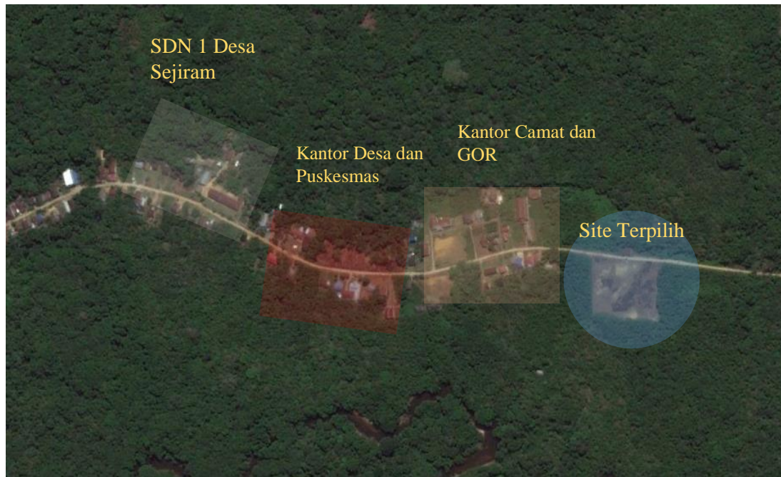
Gambar 9 Keadaan Daerah Lokasi Site

Desa Sejiram adalah pusat pemerintahan Kecamatan Seberuang. Lokasi dan Tapak untuk Rumah Sakit Ibu dan Anak akan di pilih di daerah Desa Sejiram dengan alasan wilayah daerah yang paling sesuai dengan kriteria untuk pembangunan Rumah Sakit.