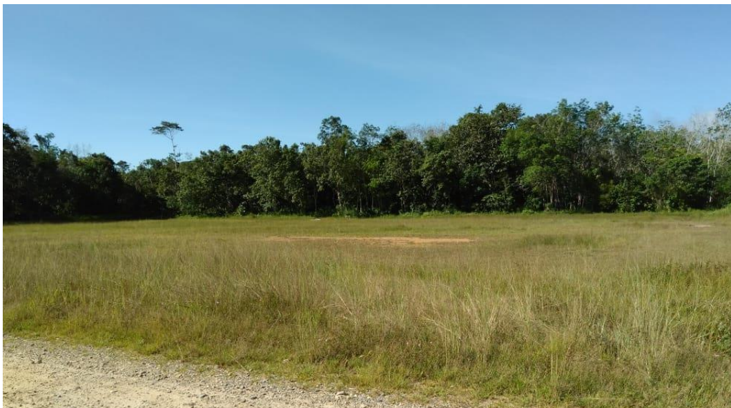
Gambar 14 Tampak Selatan Site

Bagian timur site bebatasan dengan hutan. Tampak bagian Barat hampir sama seperti tampak timur yang berbatasna dengan hutan.