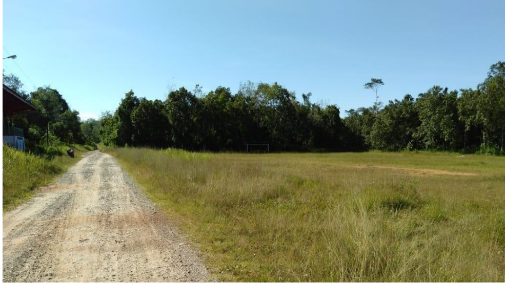
Gambar 13 Tampak Timur Site

Bagian timur site bebatasan dengan hutan. Tampak bagian Barat hampir sama seperti tampak timur yang berbatasna dengan hutan.