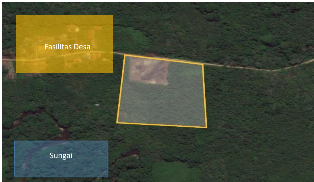
Gambar 11 12 Kondisi Site