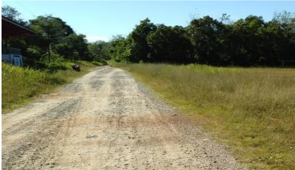
Gambar 12 Kondisi Jalan

jalan sebagai akses ke site belum bisa dianggap baik karena hanya timbunan pasir dan batu serta urukan tanah. Akses dapat dilalui mobil dan kendaraan bermotor lainnya.