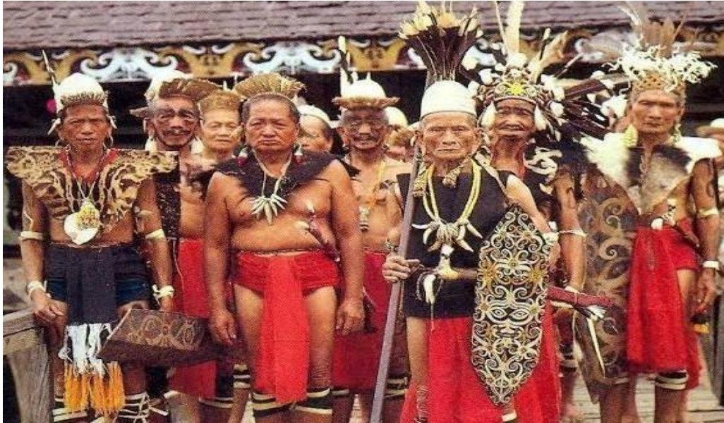
Gambar 7 Suku Dayak

Budaya yang terdapat di Kecamatan Seberuang adalah budaya suku Dayak. Dayak adalah suku asli yang mendiami daerah Kecamatan Seberuang. Beberapa daerah di Kecamatan Seberuang masih memegang teguh cara hidup orang Dayak. Terdapat beberapa penduduk yang bersuku atau ras lain di Kecamatan Seberuang tapi tidak banyak, beberapa adalah pendatang. Suku atau ras lain yang ada di Kecamatan Seberuang adalah Melayu dan Tionghoa.