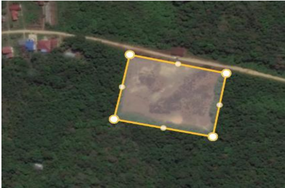
Gambar 15 luasan Site 10.000 m 2