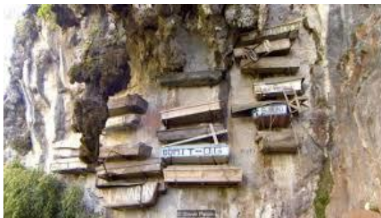
Gambar 1. 2 Pemakaman Suku Igorot, Filipina