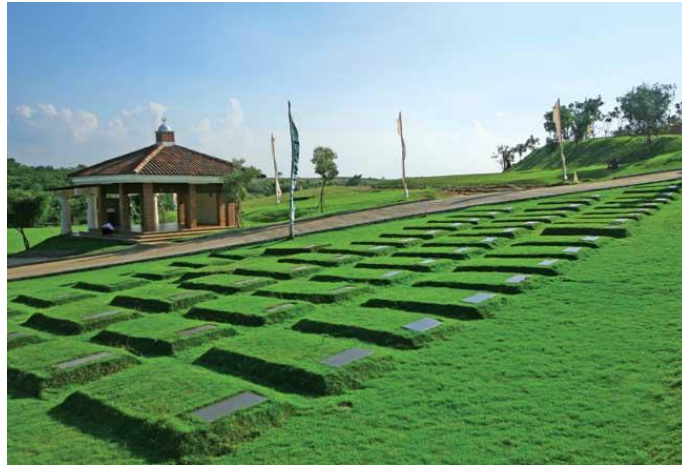
Gambar 1. 4 Komplek Charity Mansin, San Diego Hills