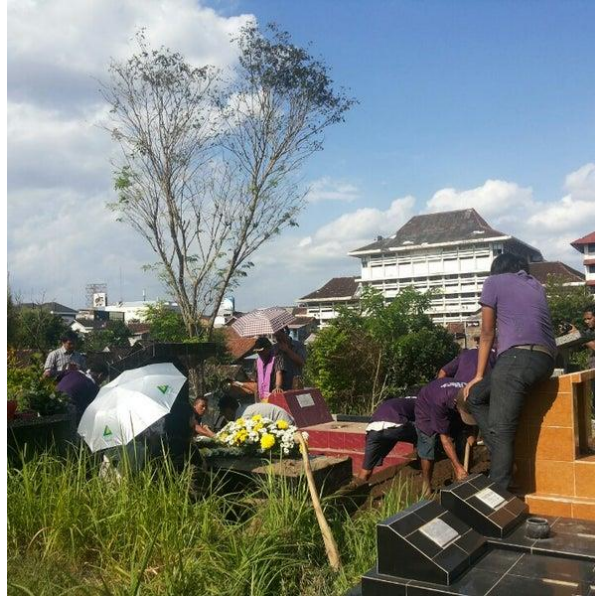
Gambar 1. 6 TPU Utaralaya di Tegalrjo, Yogyakarta