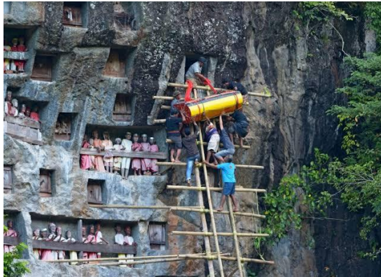
Gambar 1. 3 Pemakaman Tana Toraja