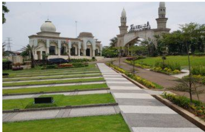
Gambar 1. 5 Kavling Pemakaman Al-Azhar Memorial Garden

Indonesia juga memiliki Al-Azhar Memorial Garden, yaitu pemakaman modern dengan fasilitas lengkap yang syariah khusus untuk agama Islam. Dengan sarana-prasarana yang menyerupai San Diego Hills, Al-Azhar Memorial Garden menghadirkan pemakaman dengan mengutamakan kaidah-kaidah dan syariat agama islam. Keadaan lahan pemakaman modern dengan fasilitas lengkap yang tertata dan nyaman menjadi lebih diminati daripada TPU yang dikelola pemerintah. Kondisi TPU yang dikelola pemerintah kerap mengeluarkan kesan angker karena tidak terurus dengan baik. Hal tersebut diperkuat dengan adanya pungli, pengemis dadakan, dan pedagang asongan saat proses pemakaman atau musim ziarah, sehingga menjadi sangat menggagu. 24