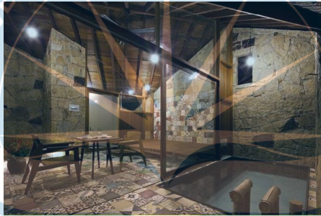
Gambar 2.11 Interior 9 Spa

Dengan kata lain, dengan cara apapun yang diperlukan, alam diperlakukan sebagai nilai inti yang penting, bahwa keindahannya dapat di renungkan di setiap sudut proyek. Dengan menggunakan bahan-bahan local seperti batu dan kayu bersama dengan mengadopsi furniture lama, 9 Spa memberikan nilai luar biasa untuk proyek yang ada.