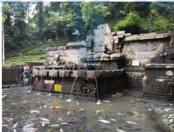
Gambar 2.2 Tapa Ngambang