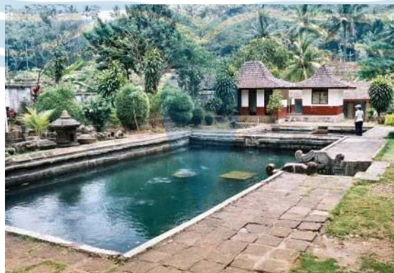
Gambar 2.8 Candi Umbul