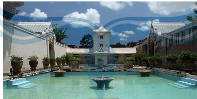
Gambar 2.4 Taman Sari