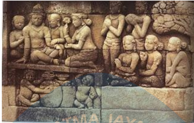
Gambar 2.1 Relief Candi Borobudur

menunjukkan Ratu Maya yang kaki dan tangannya sedang di pijat oleh para dayang-dayangnya.