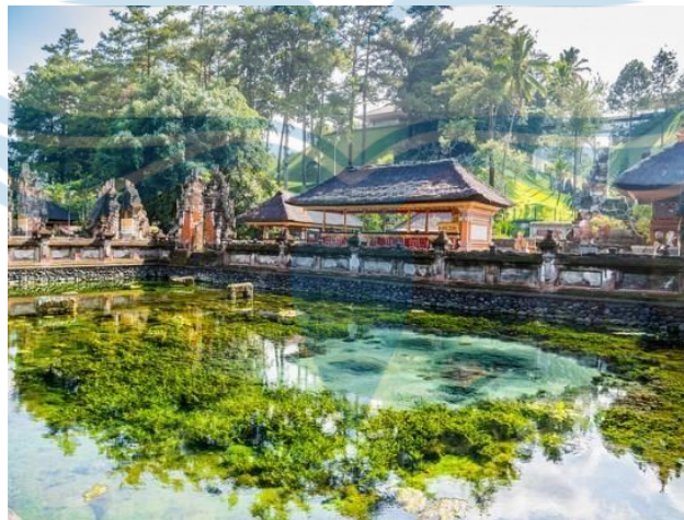
Gambar 2.6 Tirta Empul Tampaksiring