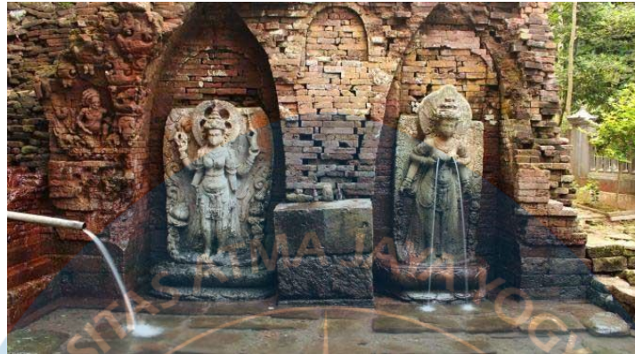
Gambar 2.7 Candi Belahan