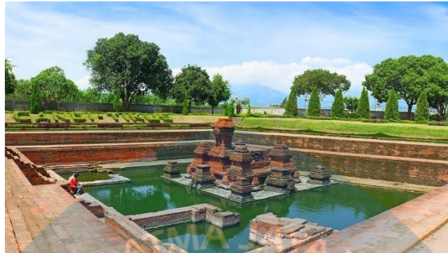
Gambar 2.3 Candi Tikus