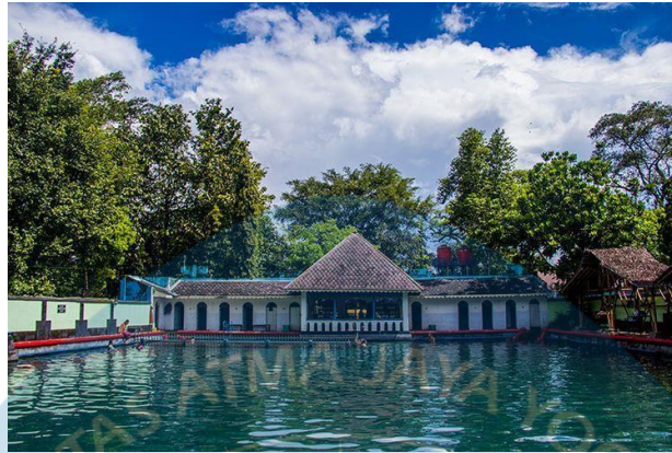
Gambar 2.5 Umbul Pengging