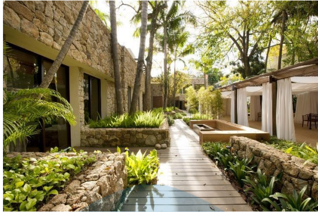
Gambar 2.9 Kennzur Spa