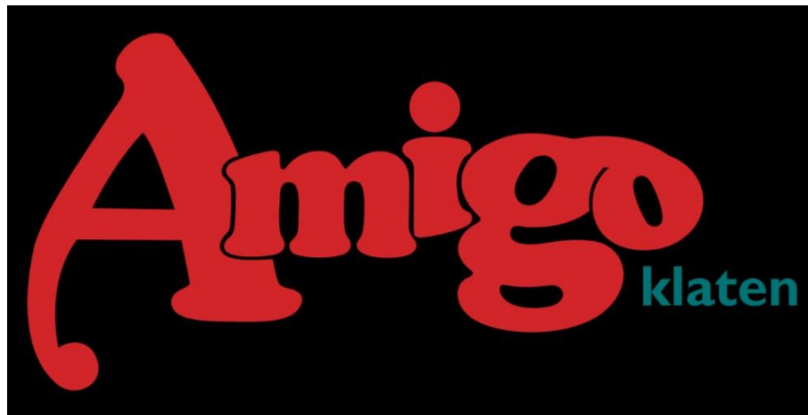
Gambar 1. Logo Amigo Klaten