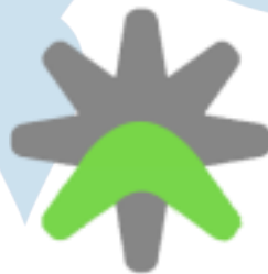
Gambar 2.3. Spark of Innovations

Solution ways merupakan komponen yang digambarkan sebagai titik pertemuan dari tiga elemen dan menjadi pilar utama dari perusahaan. Pertemuan tiga elemen ini mewakili adanya kesepakatan dan juga upaya solutif yang diharapkan mampu diberikan oleh PT. Cipta Sedaya Digital Indonesia untuk para rekan bisnis perusahaan. Visi dari perusahaan dituangkan pada komponen solution ways sebagai jawaban dari kebutuhan para rekan bisnis dalam menjalankan kegiatan perusahaan mereka masing-masing (Berijalan, n.d)