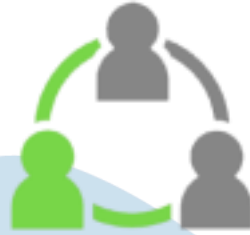
Gambar 2.4. Collaboration

menciptakan inovasi baru yang dapat dipercaya dengan wujud adanya kolaborasi dengan perusahaan yang dapat dipercaya pula (Berijalan, n.d).