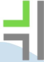
Gambar 2.2. Solution Ways

komponen tersebut adalah solution ways , spark of innovations , dan collaboration (Berijalan, n.d).