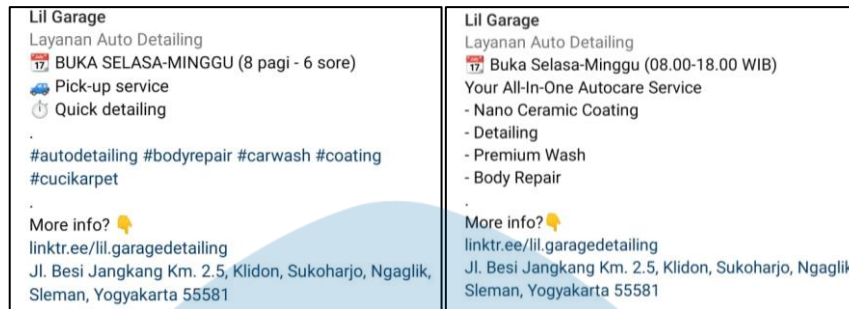
Gambar 7.2. Tampilan Biografi Akun Sebelum dan Sesudah

perusahaan. Maka dari itu dilakukan perubahan informasi biografi akun seperti Gambar 7.2.