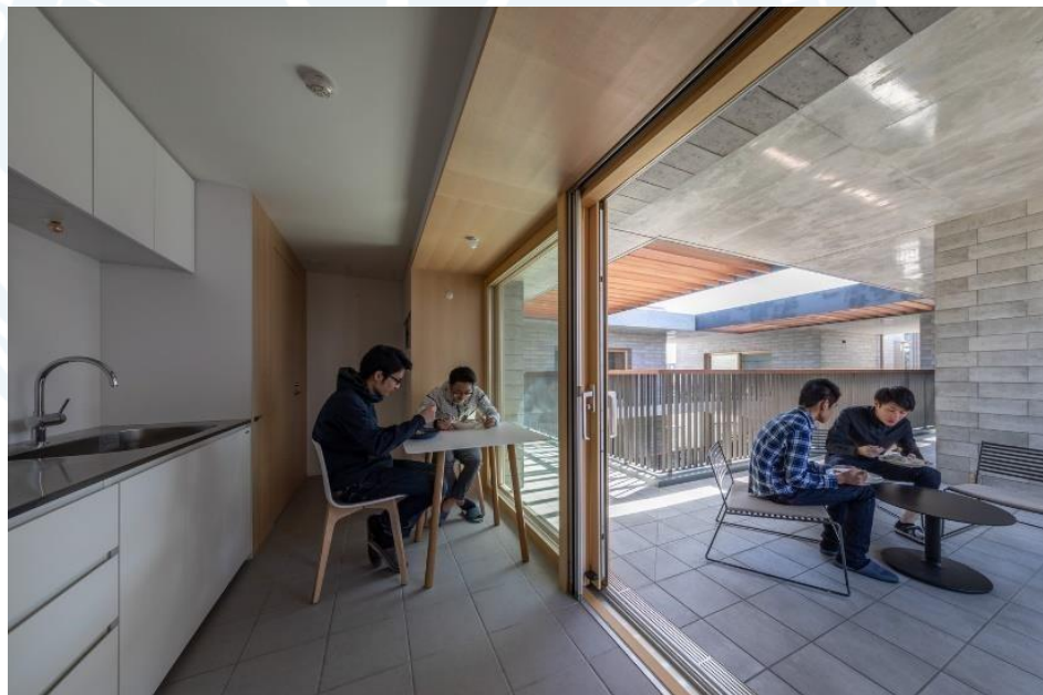
Gambar 2.3 Suasana Dapur yang Menghadap Open Space