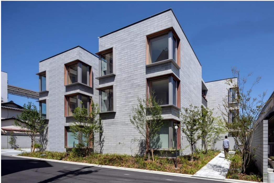
Gambar 2.1 Asahi Facilities Hotarugaike Dormitory