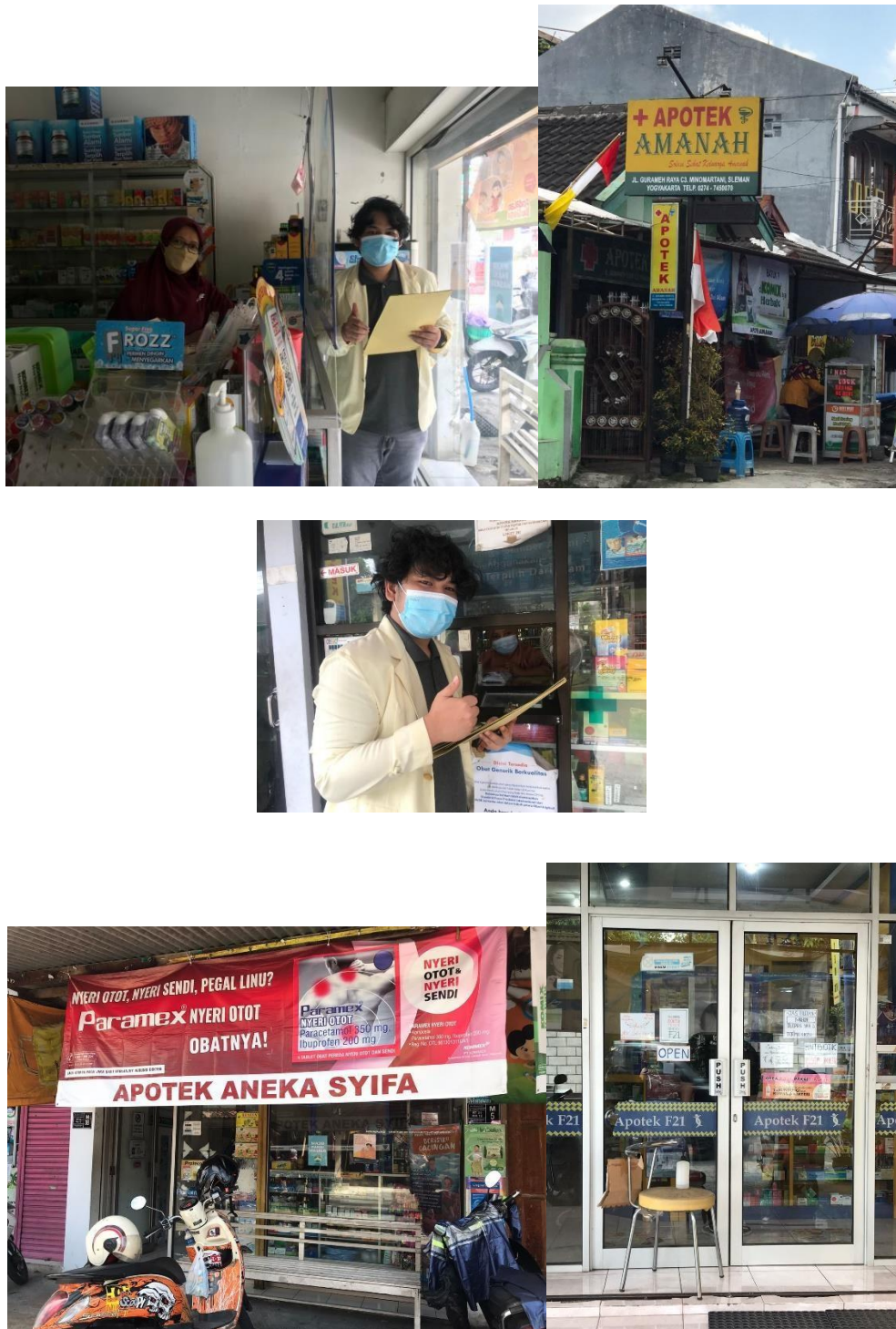
Gambar 2. Dokumentasi dengan para responden