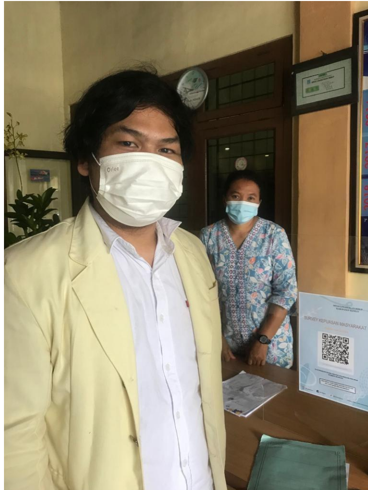
Gambar 1. Dokumentasi dengan Narasumber di Dinas Lingkungan Hidup Kabupaten Sleman