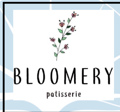
GAMBAR 6 Logo Bloomery Patisserie