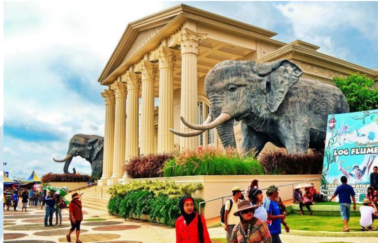
Gambar 4 “Jawa Timur Park 2”