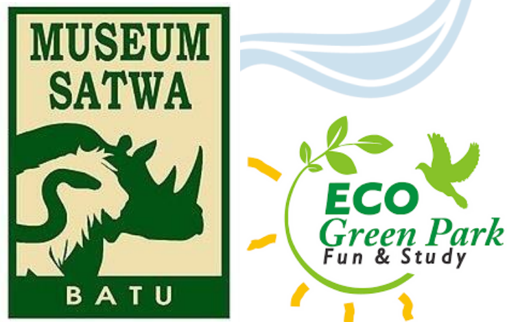
Gambar 6 “Logo Museum Satwa dan Eco Green Park”

Batu Secret Zoo merupakan atraksi utama dari Jawa Timur Park 2. Berbagai jenis hewan dapat ditemukan di kebun binatang seluas 15 hektar ini. Setiap zona yang ada di Batu Secret Zoo didesain menyerupai habitat asli hewan tersebut. Terdapat kurang lebih 10 zona berbeda yang bisa dikunjungi, seperti Area Monkey World, Area Monkey Island, Area Reptile, Nocturnal House, Area Aquarium, Area Savannah, Area Fantasy Land and Happy Land, Baby Zoo, Area Safari, dan Area Tiger Land (Salsawisata,2021).