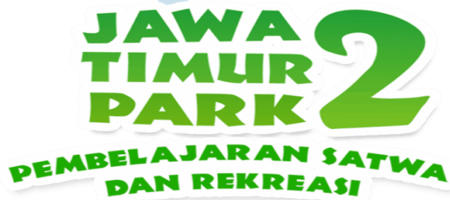
Gambar 7 “Logo Jawa Timur Park 2”

((Sumber : JTP.id, 2012) diakses pada 25 Maret 2022 pukul 12.00 WIB)