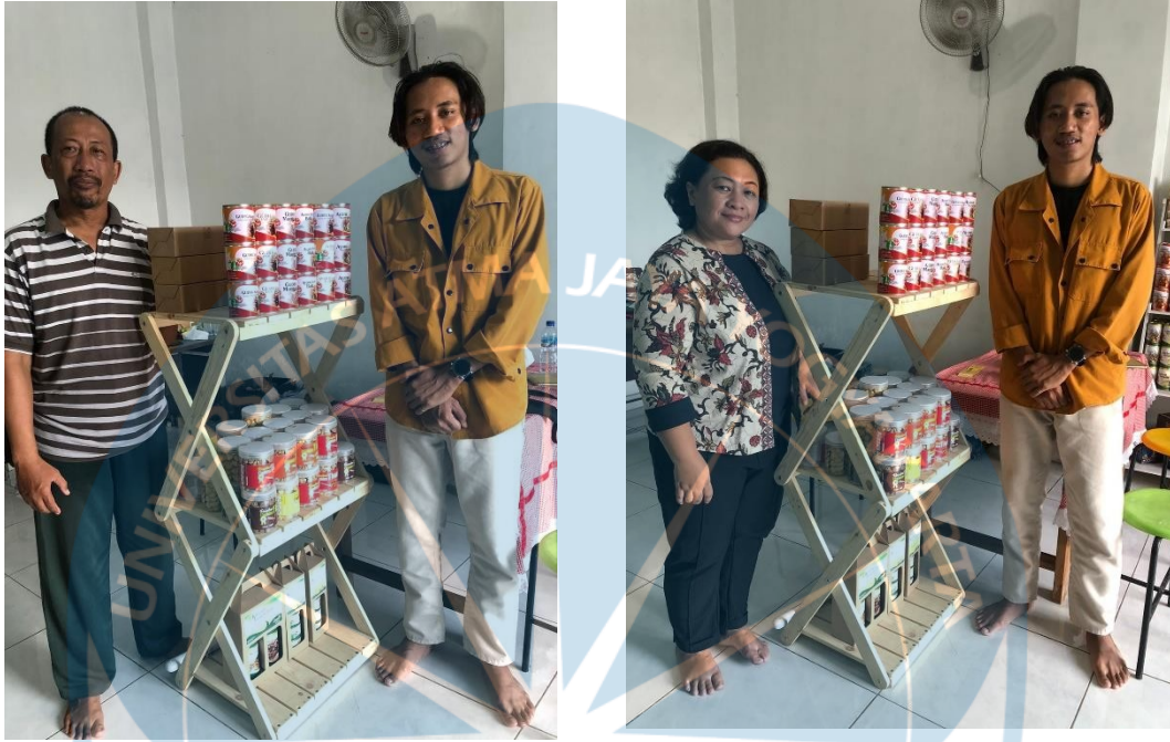
Foto dengan Pemilik Rosaline Cookies.