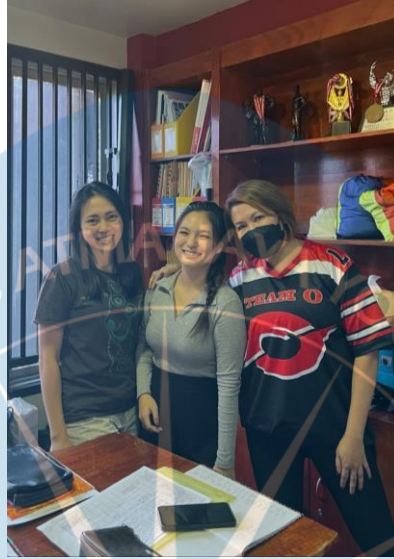
Foto dengan owner Optimum Fitness