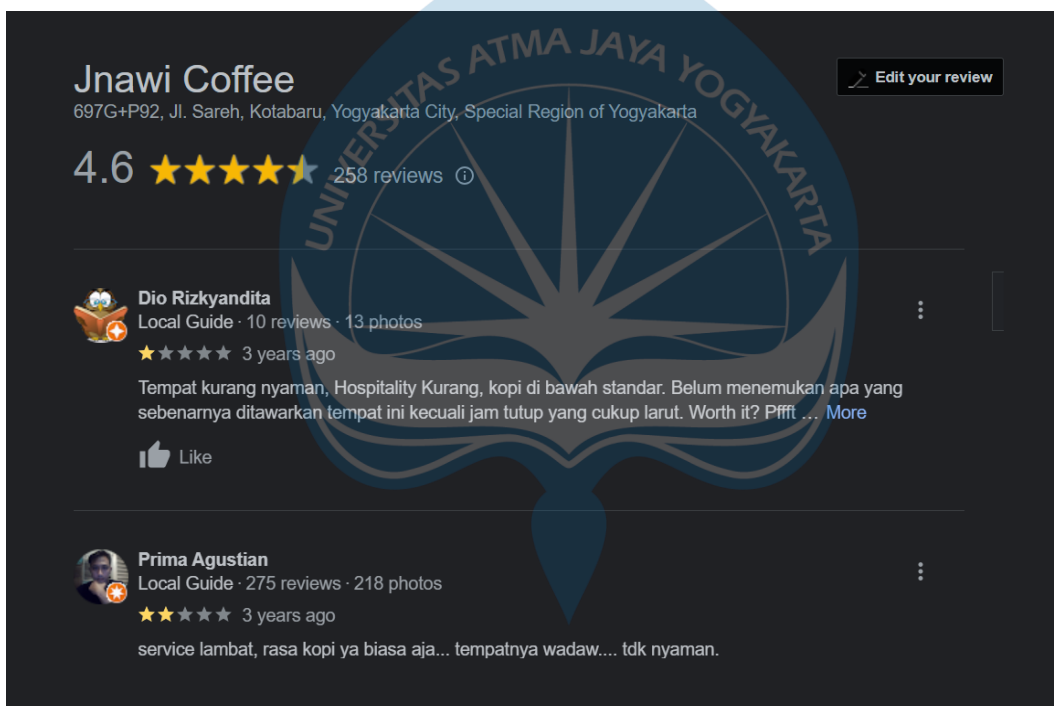
Gambar 1.2. Bukti Googel Review Jnawi Coffee & Roastery

dilakukan dengan konsumen yang menyatakan permasalahan pelayanan yang diberikan oleh Jnawi Coffee & Roastery masih kurang sesuai dengan keinginan konsumen, seperti fasilitas parkir mobil yang kurang luas dan terlalu jauh dari coffee shop , fasilitas penerangan yang kurang baik untuk penglihatan malam hari, fasilitas kursi yang kurang nyaman dikarenakan tidak terdapat sandaran punggung pada kursi, kurangnya product knowledge pekerja yang rendah mengakibatkan ragunya konsumen dalam melakukan pemesanan. Informasi mengenai permasalahan di Jnawi Coffee & Roastery juga didapatkan melalui media sosial google review . Media tersebut digunakan untuk membantu memberikan kritikan dan saran oleh konsumen yang berkunjung. Gambar 1.2. merupakan bukti google review yang diberikan oleh konsumen.