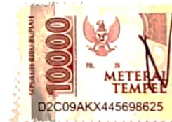
Pramesti Dwi Qur'ani