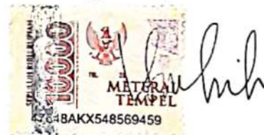
Virgy Violinh Br Sinuhaji