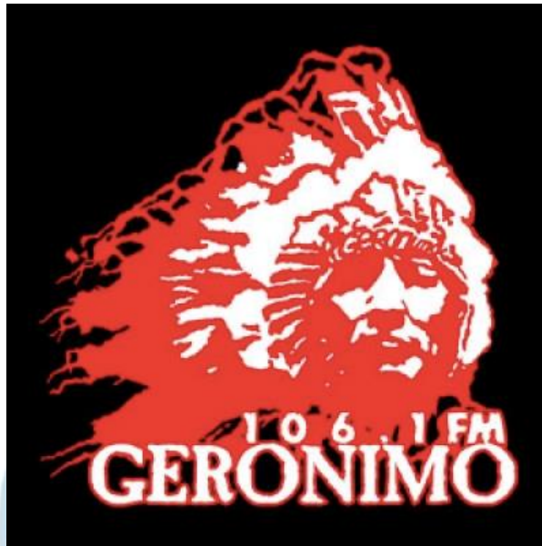
Gambar 2.1 Logo Geronimo FM

Logo Geronimo FM terinspirasi dari semangat suku Indian yang dikenal dunia sebagai pejuang yang tangguh. Karakter seorang Indian tepat untuk mewakili ketangguhan Radio Geronimo selama puluhan tahun berjuang untuk mengangkat potensi Yogyakarta yang penuh dengan kekuatan budaya dan kreativitas generasi muda (Geronimo FM, 2019).