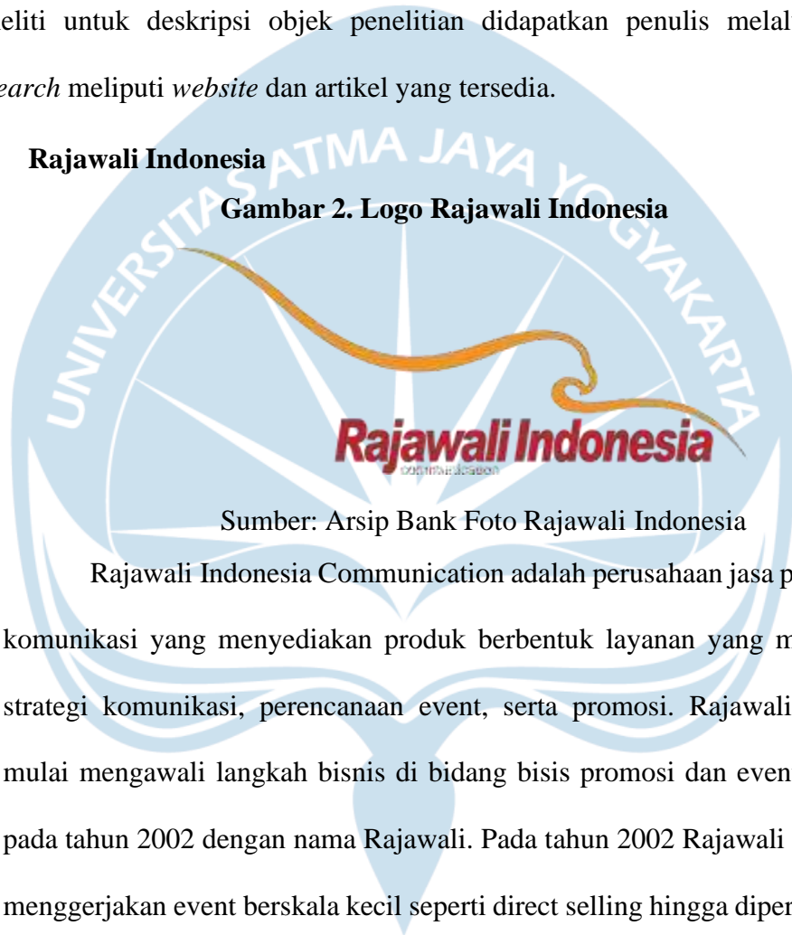
Gambar 2. Logo Rajawali Indonesia