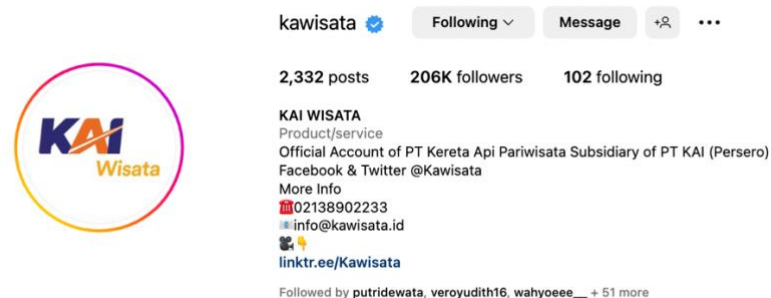
Gambar 8. Profil Akun Instagram @kawisata