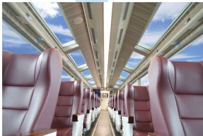
Gambar 6. Tampilan Kursi Penumpang Pada Kereta Panoramic