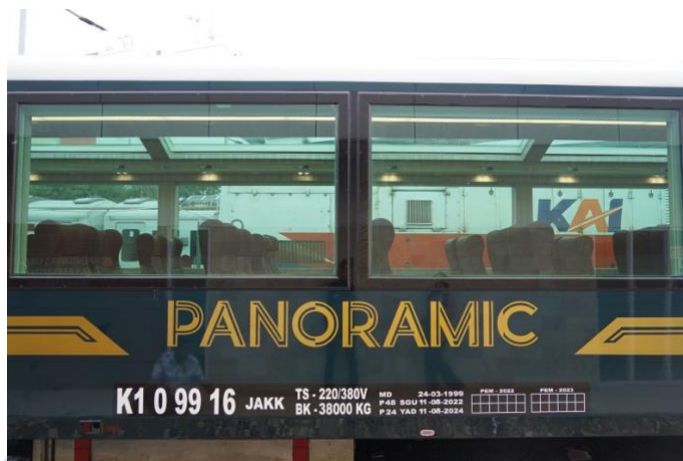
Gambar 7. Tampak Luar Kereta Panoramic