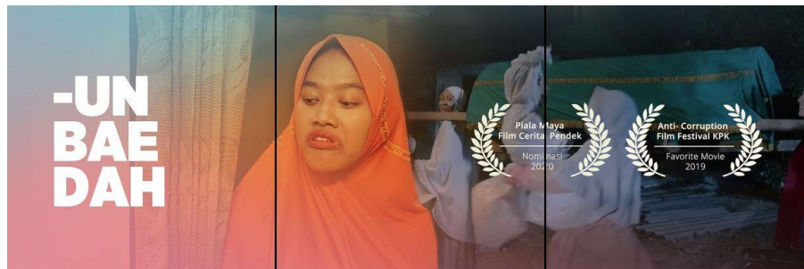
Gambar 2.2 Penghargaan Film UNBAEDAH