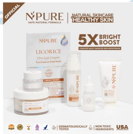
Gambar 2.5 Rangkaian Produk Skincare Licorice N'pure