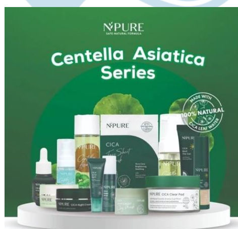
Gambar 2.2 Rangkaian Produk Skincare Centella Asiatica N'pure