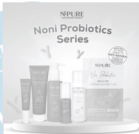
Gambar 2.4 Rangkaian Produk Skincare Noni Probiotics N'pure

husus untuk kulit sensitif yang tentunya minim iritasi dan cocok untuk semua tipe kulit.