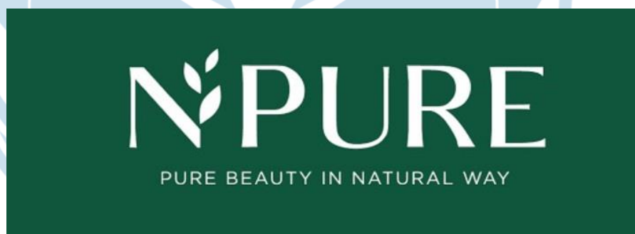
Gambar 2.1 Logo N'pure

N'pure merupakan salah satu brand skincare lokal dengan komitmen mereka untuk menghadirkan produk-produk skincare yang menggunakan bahan-bahan alami. N'pure sudah beroperasi sejak tahun 2017 dan hingga saat ini mereka memiliki banyak jenis skincare yang dapat membantu merawat kulit masyarakat Indonesia (Maulia, 2022).