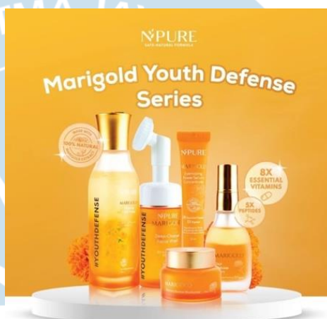
Gambar 2.3 Rangkaian Produk Skincare Marigold N’pure