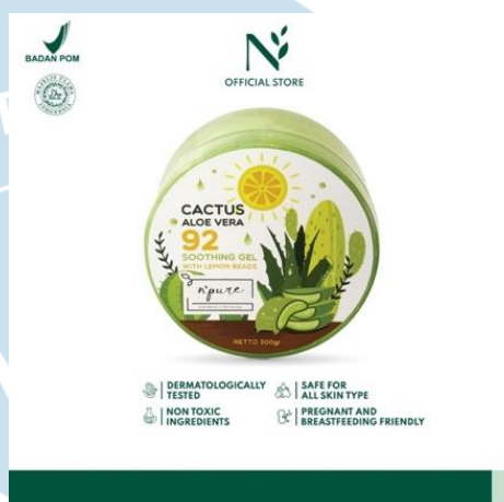
Gambar 2.6 Produk Skincare Soothing Gel Cactus Aloe Vera