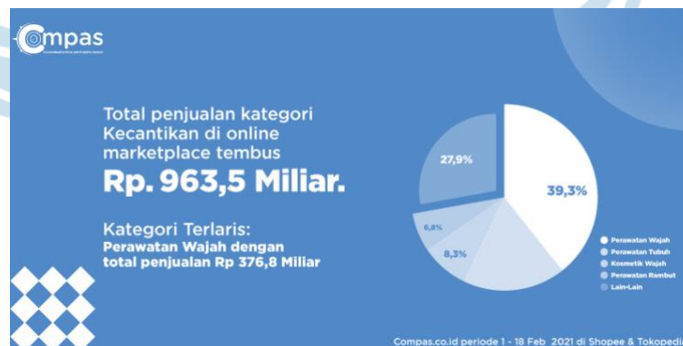
Gambar 2.8 Total Penjualan Produk Kecantikan di E-commerce Tahun 2021

pada perilaku pembelian konsumen. Dalam media sosialnya, N'pure sering kali membuat konten-konten yang sedang ramai di masyarakat, misalnya seperti melakukan challenge (tantangan) dengan orang di sekitar atau membuat konten dengan musik-musik yang sedang viral. Melalui konten-konten N'pure di TikTok, N'pure dapat menginformasikan, menghibur dan melakukan interaksi dengan konsumen mereka yang dapat berdampak pada minat beli para konsumen terhadap produk-produk skincare N'pure. Namun, walaupun N'pure sudah memanfaatkan media sosial TikTok mereka (@npureofficial) dengan baik, penjualan N'pure masih berada di bawah brand kompetitor lainnya. Hal ini juga di dukung oleh data penjualan N'pure pada tahun 2021.