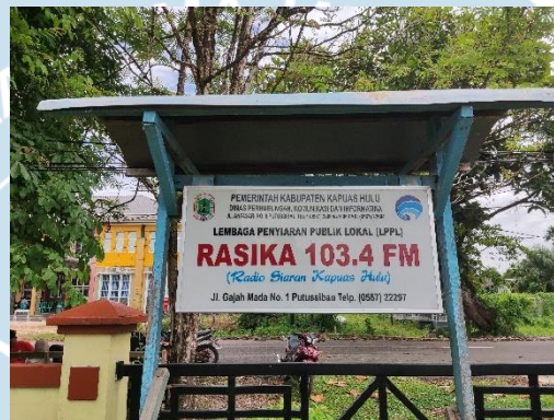
GAMBAR 2.1 Radio Lembaga Penyiaran Publik Lokal (LPPL) Rasika Kapuas Hulu

Penyelenggaran Penyiaran (Jaringan Dokumentasi dan Informasi Hukum BPK, n.d.). Nama udara dari Radio Lembaga Penyiaran Publik Lokal (LPPL) yaitu Rasika 103,4 FM. Radio Lembaga Penyiaran Publik Lokal (LPPL) Kapuas Hulu berlokasi di jalan Antasari No.8 Putussibau Kota, Kapuas Hulu, Kalimantan Barat.