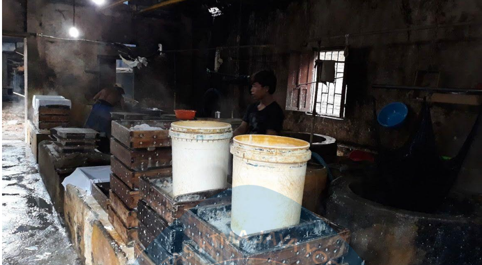
Kegiatan pembuatan tahu di Desa Karangnom