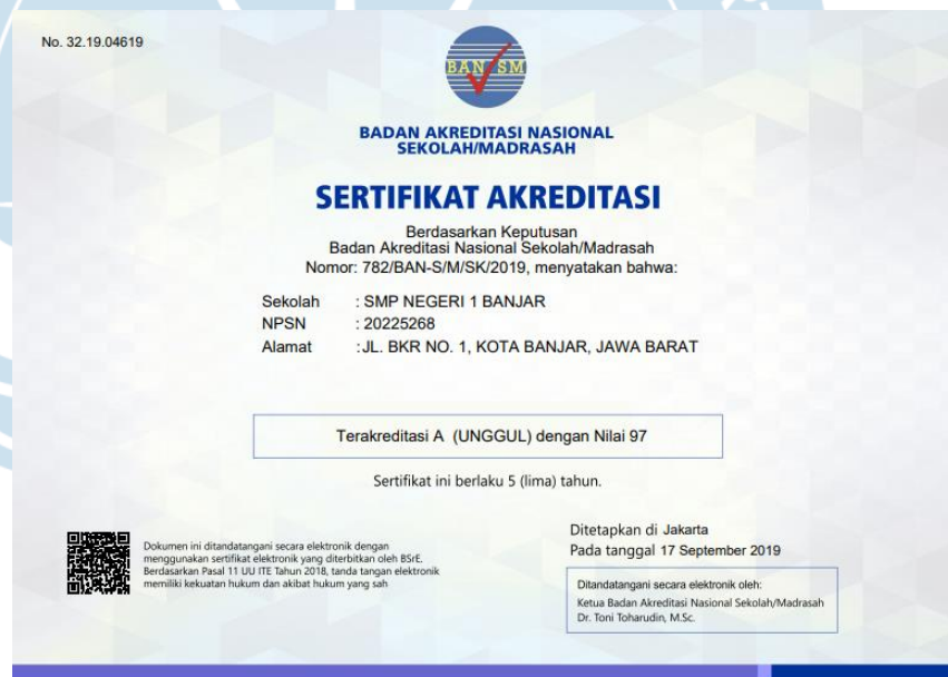
Gambar 2.2 Sertifikat akreditasi SMPN 1 Banjar

Barat ini pertama kali didirikan pada 17 Februari 1951. Hingga saat ini SMPN 1 Banjar masih menerapkan kurikulum tahun 2013 dengan dipimpin oleh Bapak Aa Hasan Gunara sebagai Kepala Sekolah. Jam belajar yang berlaku di SMPN 1 Banjar yaitu menggunakan sistem full-day dari hari Senin hingga Jumat dengan jam masuk dimulai dari pukul 07.00 wib hingga 15.00 wib. Berdasarkan hasil keputusan BAN (Badan Akreditasi Nasional) pada tahun 2019, SMPN 1 Banjar ditetapkan sebagai sekolah terakreditasi A (unggul) dengan nilai rata-rata 97.