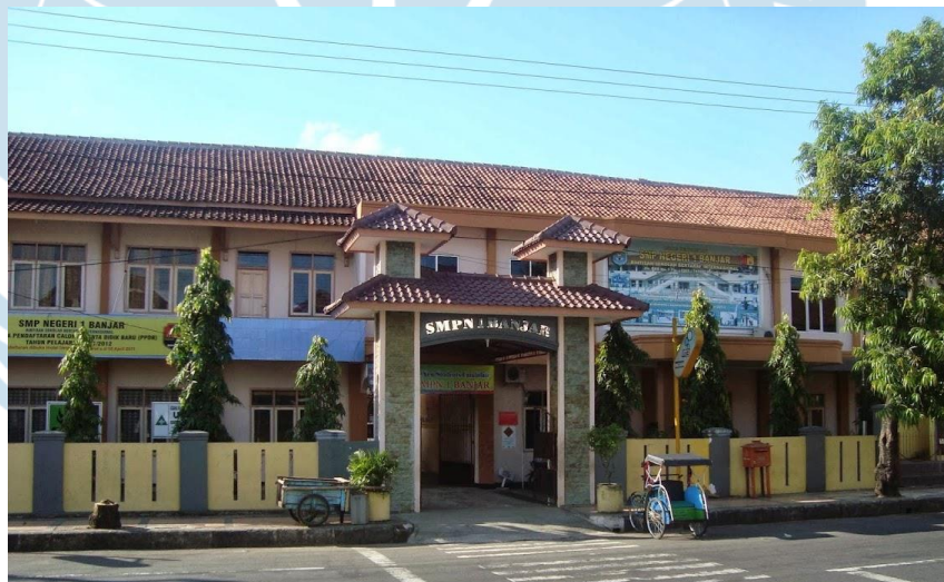
Gambar 2.1 SMPN 1 Banjar