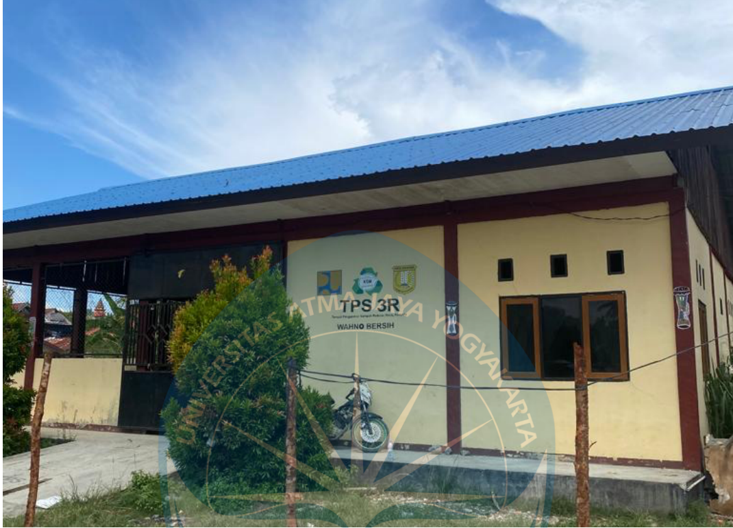
Lampiran 5 : TPS 3R di Pasar Induk Youtefa