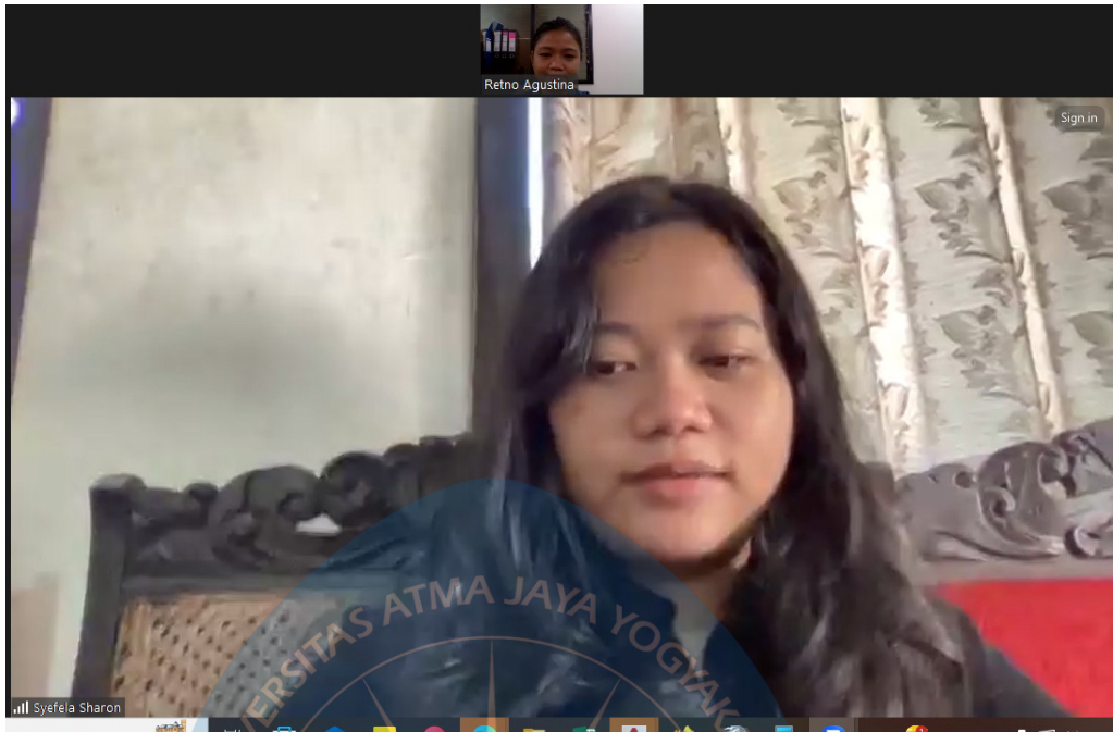
Lampiran 6 : Zoom bersama Wahana Lingkungan Hidup Kota Jayapura