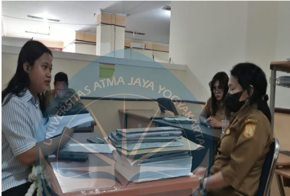
Lampiran 1 : Melakukan wawancara dengan Responden yakni dari pihak Dinas Lingkungan Kota Jayapura.