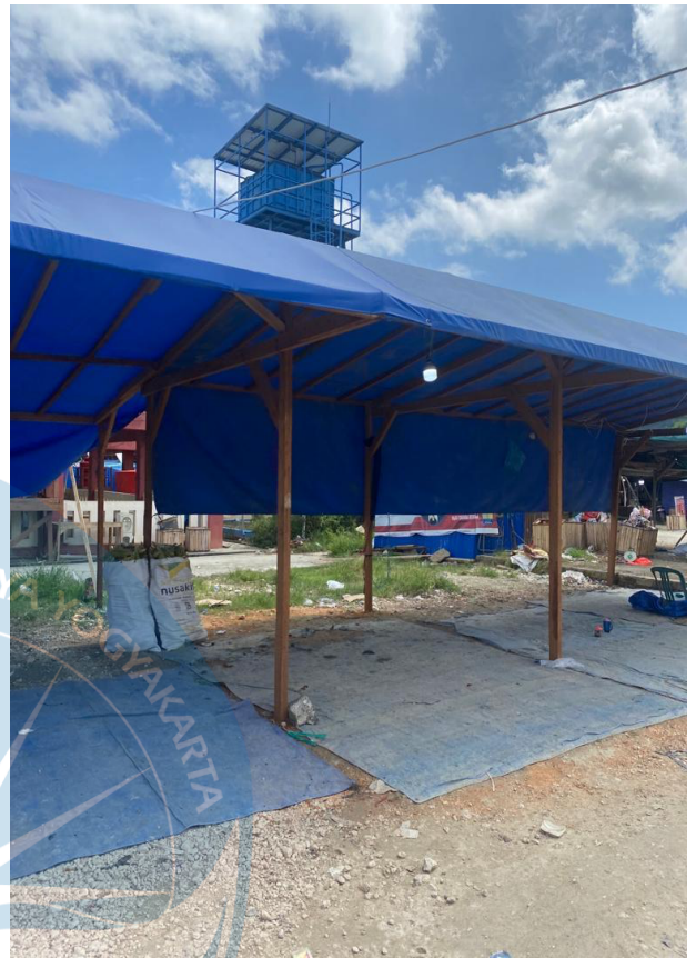
Lampiran 3 & 4 : Bilik pedagang