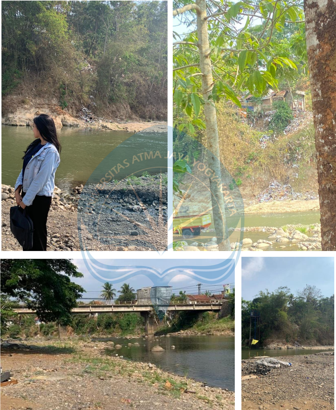
Keterangan : Gambar Sungai Ciwulan di Kota Tasikmalaya, Jawa Barat. hari Kamis, 2 November 2023 Pukul 16.00 WIB.