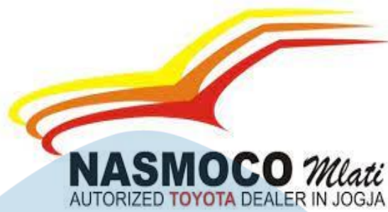
Gambar 4. Logo PT Nasmoco Bahtera Motor