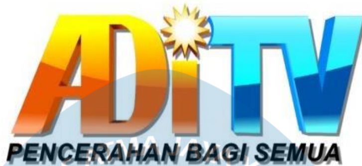
GAMBAR 8 Logo ADiTV