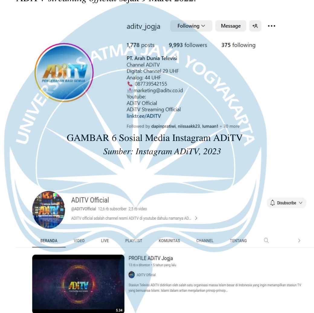
GAMBAR 6 Sosial Media Instagram ADiTV

menjadikan ADiTV kini bersiaran hingga 24 jam semenjak tahun 2022. Bulan April 2022, ADiTV bahkan dapat dinikmati oleh publik lewat TV streaming pada website lensa44.com atau melalui YouTube ADiTV streaming official sejak 9 Maret 2022.