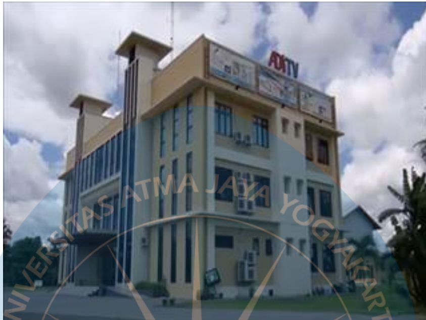
GAMBAR 5 Gedung ADiTV