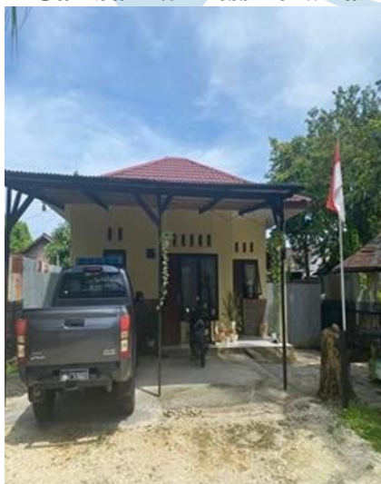
Gambar 2.5 Mess Perwira

Lokasi dalam penelitian ini adalah Asrama Polisi Kota Biak. Asrama Polisi Kota Biak merupakan kompleks perumahan yang diperuntukkan bagi para anggota Kepolisian Resor Biak Numfor. Asrama ini masih berada dalam satu wilayah dengan Polres Biak Numfor (Kota Biak) yang berlokasi di Jl. Pangeran Diponegoro, Burokub, Kabupaten Biak Numfor, Papua (98112). Dalam penelitian ini, peneliti memilih Asrama Polisi Kota Biak karena merupakan salah satu kawasan tempat tinggal bagi anggota Polisi bersama keluarganya.