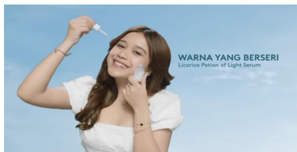
Gambar 2. 2. Brisia Jodie

Brisia Jodie Maurine merupakan artis sekaligus penyanyi asal Indonesia yang lahir di Yogyakarta pada tanggal 30 Maret 1996. Brisia memulai karirnya pada tahun 2018, sejak ia menjadi salah satu kontestan dalam ajang Indonesian Idol (Dailysia.com, 2023). Hingga saat ini, Brisia telah beberapa kali membawakan sejumlah merek ternama dan salah satunya adalah merek N’PURE.